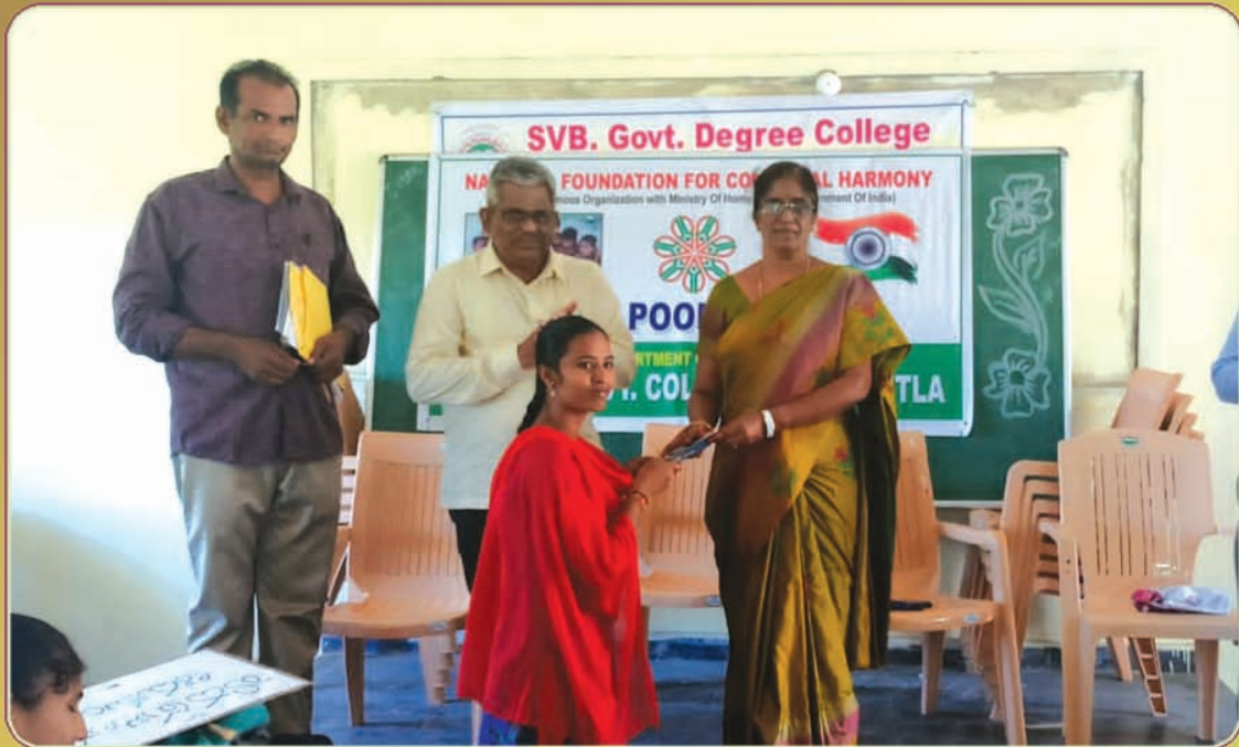
Principal of the college appreciating the students by giving prize on 23-11-2021